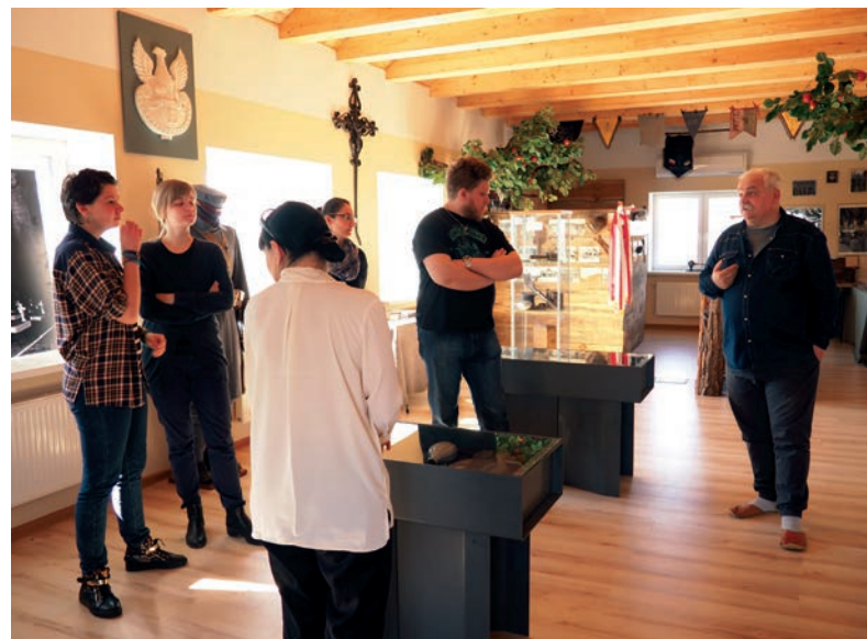
Nie dajmy zapomnieć...

Warto podkreślić, że Centrum Dialogu w Kostiuchnówce to po prostu wyjątkowe miejsce, podtrzymujące pozytywne relacje polsko-ukraińskie i kultywujące pamięć o polskiej historii.