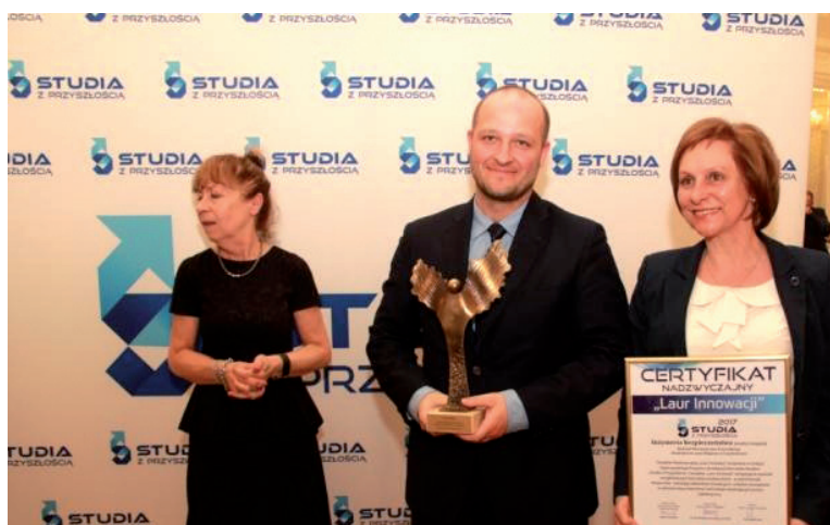
Pracownicy AJD odbierają certyfikat

wspierających proces dydaktyczny). Ocenę akredytacyjną przeprowadziła Fundacja Rozwoju Edukacji i Szkolnictwa Wyższego oraz Agencja PRC. Uroczystość wręczenia Certyfikatów Akredytacyjnych odbyła się 13 kwietnia 2017 roku na Gali Finałowej Programu w historycznych, zabytkowych wnętrzach Pałacu Tyszkiewiczów-Potockich Uniwersytetu Warszawskiego.