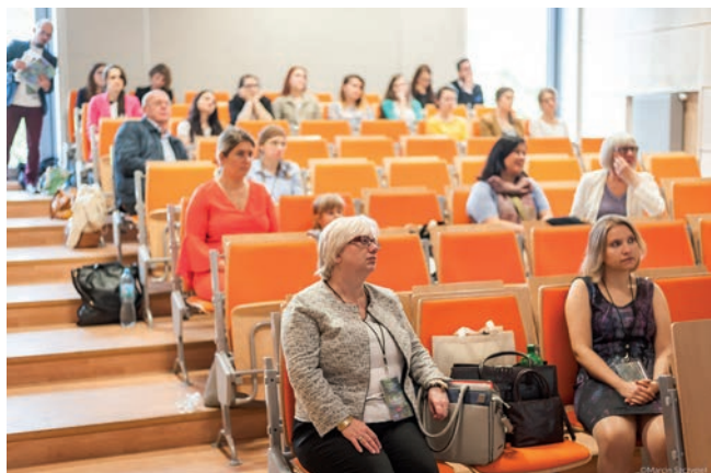
W trakcie konferencji

dociekań na temat nieoczywistych form literackich, takich jak liberatura, poezja migowa czy książka obrazkowa. Nowomediálną perspektywę uzupełniły referaty poświęcone memom internetowym oraz wideostreszczeniom lektur szkolnych. Równie intrygujące spojrzenie na literaturę, nie tylko tę najnowszą, przyniosły wystąpienia skoncentrowane wokół krytyki i teorii literatury. Słuchacze mieli więc okazję poznania współczesnych postaw wobec baśni (krytycznej, dekonstrukcji, parodii), spojrzenia na powieści Józefa Ignacego Kraszewskiego z perspektywy psychoanalizy, prób rozstrzygnięcia sporu interpretacyjnego, jaki niegdyś rozgorzał pomiędzy esencjalistami a kontekstualistami.