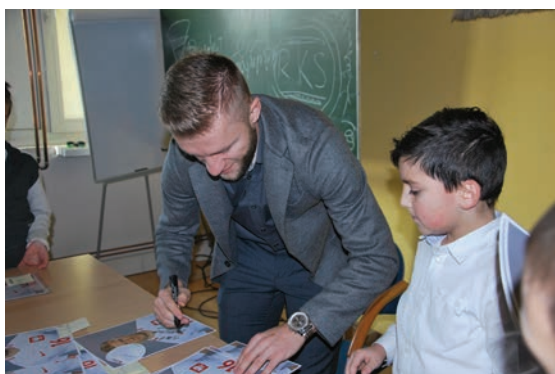
Jakub Błaszczkowski z fanami...