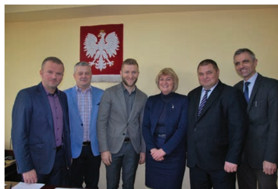
...i władzami Wydziału Pedagogicznego