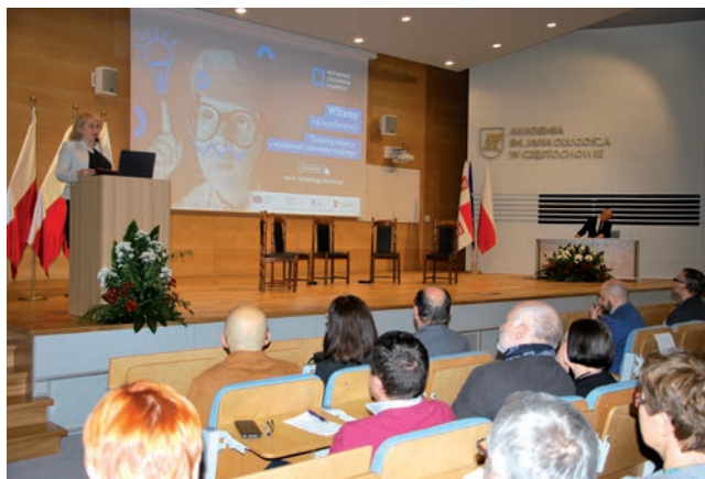
W trakcie konferencji o tutoring

Bez wątpienia wartość podejmowanych przez Towarzystwo Edukacji Otwartej w ramach ww. projektu podkreślają działania we współpracy z Akademią im. Jana Długosza. W ramach podpisanej