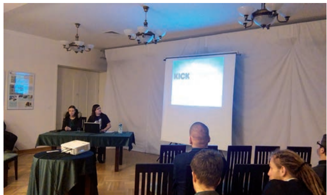
O grach wideo

giczne i medioznawcze, aż po rozważania czy eSport trafi na Igrzyska Olimpijskie. Wykład inauguracyjny wygłosił prof. Piotr Zawojski. Owoce toczonych