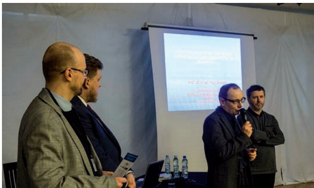
W trakcie dyskusji

dyskusji będzie można zobaczyć w formie publikacji pokonferencyjnych, a także materiałów filmowych z nagraniami niektórych wystąpień, które będą wkrótce dostępne w sieci.