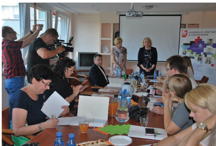
Podczas konferencji prasowej

i gospodarczego, przede wszystkim w celu analizy problemów prawnych i poszukiwania skutecznych sposobów ich rozwiązywania. Będzie posiadał umiejętność rozumienia tekstów prawnych, posługiwania