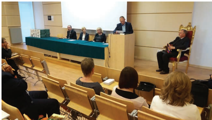
W trakcie obchodów Jubileuszu