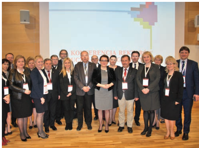
Uczestnicy obrad KRUP