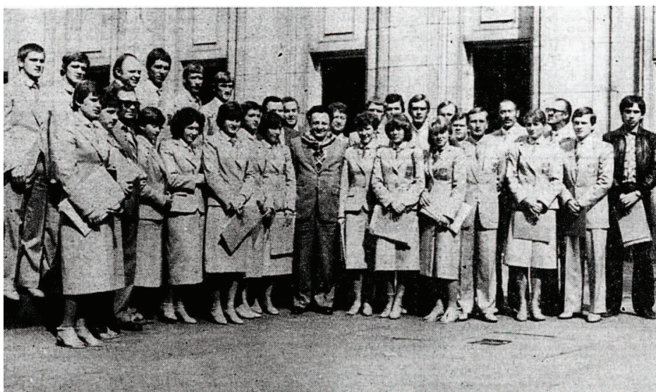
Fot. 2. Reprezentacja Zrzeszenia LZS podczas oficjalnego pożegnania przed odlotem na XXII Igrzyska Olimpijskie w Moskwie (1980 r.)

Zrzeszenia LZS 17 . W XXII Letnich Igrzyskach Olimpijskich uczestniczyło 33 zawodników LZS (ponad 10% kadry olimpijskiej) 18 i była to najliczniejsza reprezentacja w historii dotychczasowych startów 19 . Reprezentowali oni 18 ludowych klubów sportowych z 13 województw. Ponadto w skład kadry olimpijskiej weszło 12 wychowanków Zrzeszenia 20 .