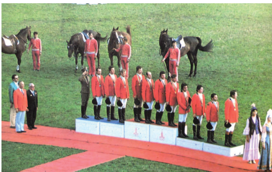
Fot. 3. Podium drużynowego konkursu skoków przez przeszkody (Moskwa, 1980 r.)