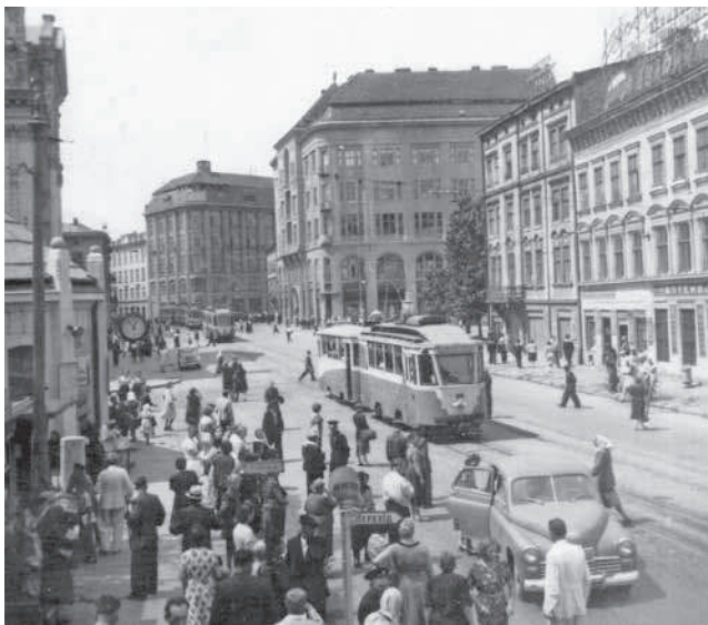
4. Невідом. фотограф, Площа Торгова / Plac Targowy , Львів, бл. 1950 р., Власник: Видавництво, Центр Європи.