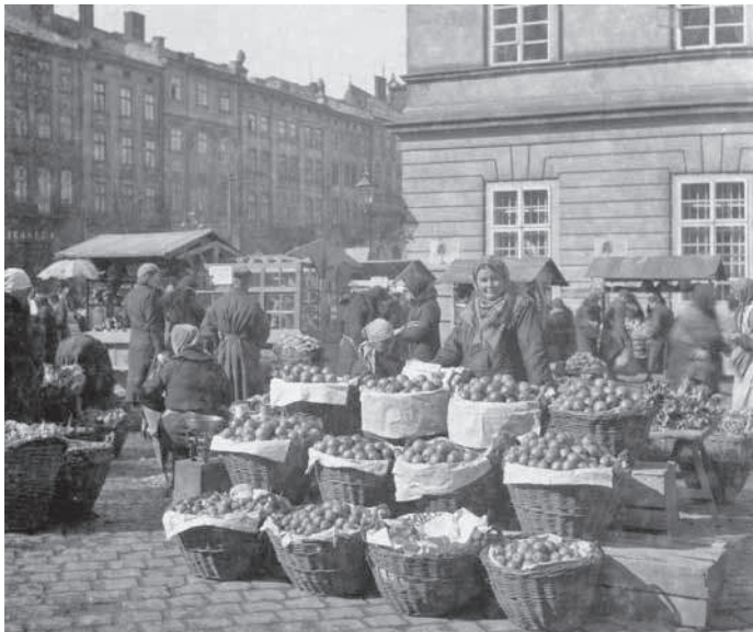
9. Фот. Отко Ян, Яблука на Ринку / Jabłka na rynku , Львів, 1935 р., 6 x 6,5 см., Власник: Анджей Отко.