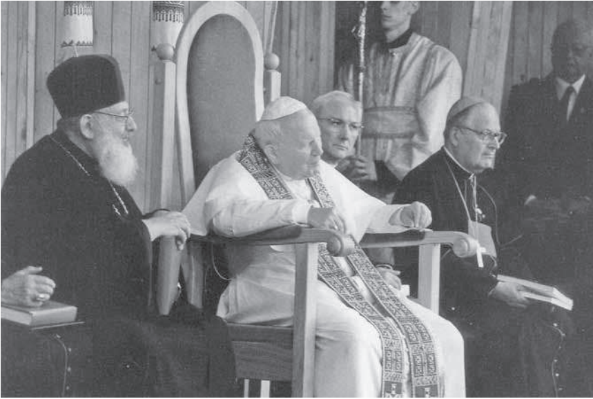
7. Святиший Отець Іван-Павло II та Глава УГКЦ Любомир Кардинал Гузар під час Літургії у візантійському обряді на Львівському іподромі / Ojciec Święty Jan Paweł II i Zwierzchnik Cerkwi Ukrainńskiej Greckokatolickiej Lubomyr-Kardynał Huzar podczas liturgii Mszy świętej w obrządku bizantyjskim na Hipodromie Lwowskim, Львів, 2001 р., 10 x 14 см.