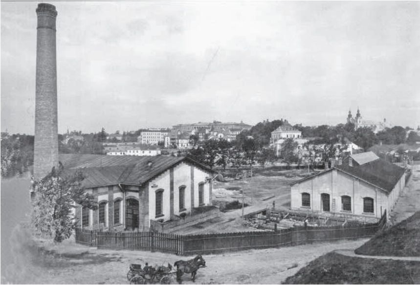
3. Фот. Францішек Рихновський, Перша львівська електростанція / Pierwsza lwowska elektrownia , Львів, 1894 р., 25 x 37 см., Власна фотографія.