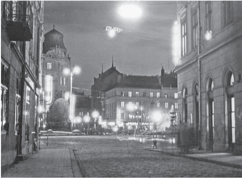
11. Невідомий фотограф, Нічний вид Львова/ Nocny widok Lwowa , Львів, 1970-ті рр., 11 x 17 см., Власник: Володимир Румянцев.