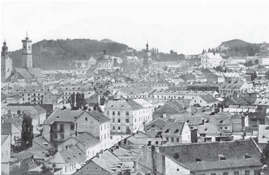
1. Загальний вид львівського середмістя з гори Вроновських / Widok ogólny śródmieścia Lwowa z Góry Wronowskich , Львів, 1860–1870 рр., 9,5 x 13,5 см.