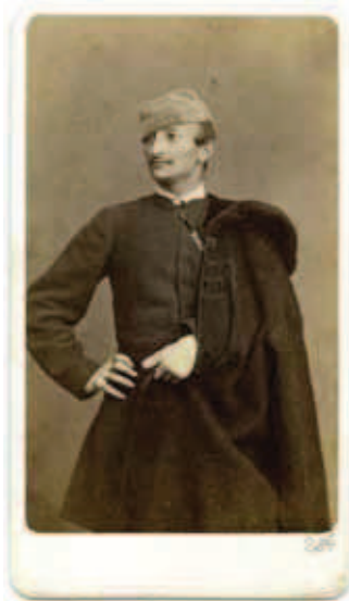
12. Артур Гроттгер/ Artur Grotger (1837-1867), Краків, 1863 р., 9 x 5,8 см., Власник: Львівський історичний музей.