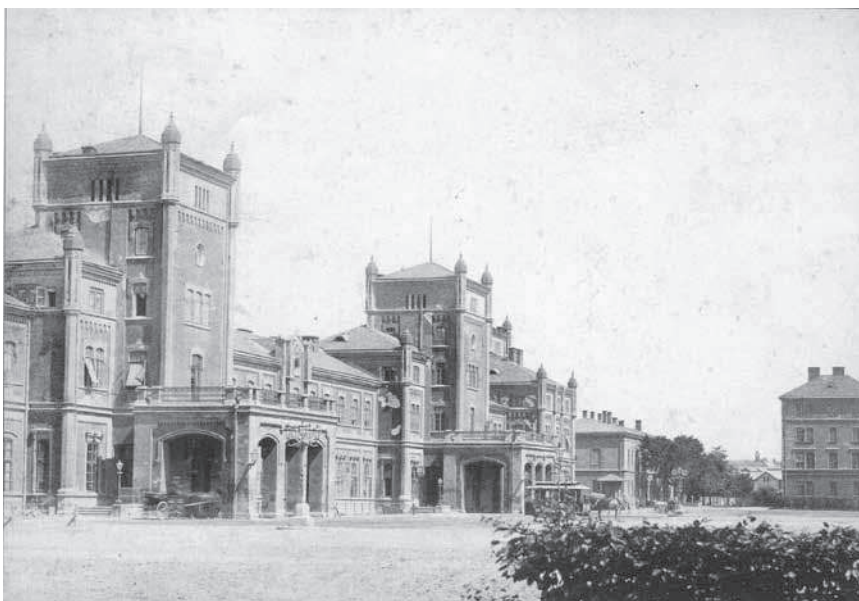
2. Фот. Юзеф Геннер, Старий львівський вокзал / Stary dworzec lwowski , Львів, бл. 1890 р., 9,5 x 13,5 см., Власна фотографія.