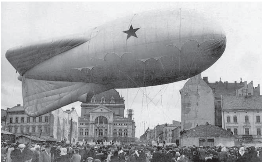
10. Невідомий фотограф, Краківський ринок / Rynek Krakowski , Львів, кінець 1940-их – поч. 1950-их рр., 6,5 x 9 см., Власник: Володимир Румянцев.