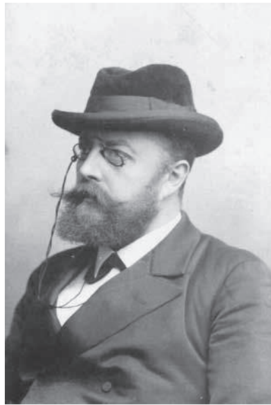
5. Історик Станіслав Шнюр-Пепловський / Historyk Stanisław Schnür-Pepłowski (1859–1900) , Львів, бл. 1900 р., 9 x 6 см.