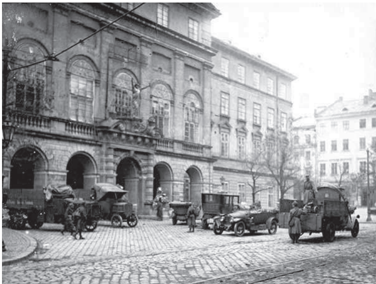
8. Невідомий фотограф, 1 листопада 1918 р. у Львові / 1 listopada 1918 r we Lwowie, Львів, 1918 р., 10 x 15 см., Власник: Л. Крип'якевич.