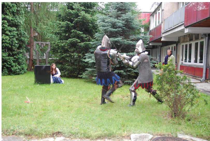
Walki Bractwa Rycerskiego w przerwie obrad konferencyjnych