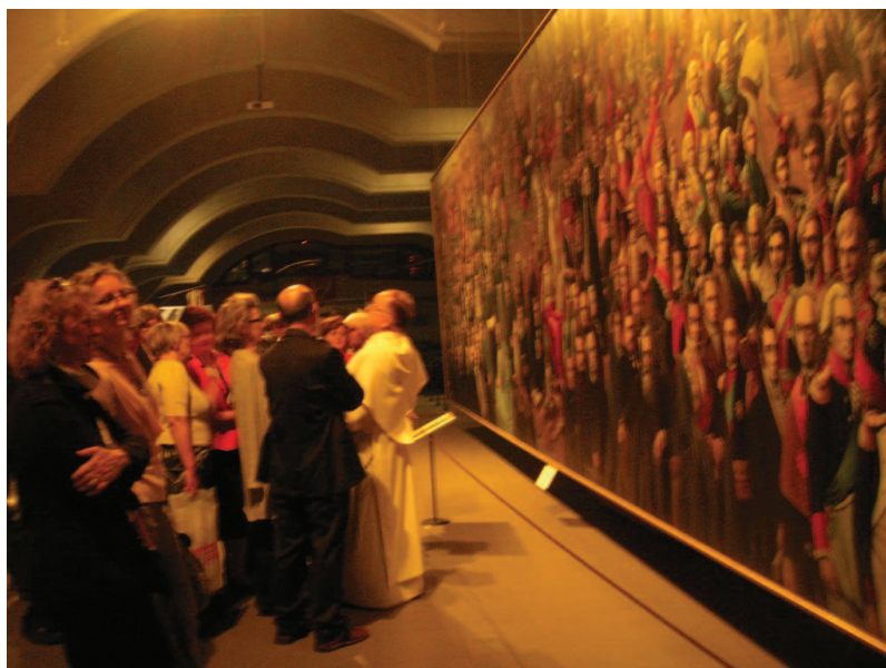
Uczestnicy konferencji na Jasnej Górze