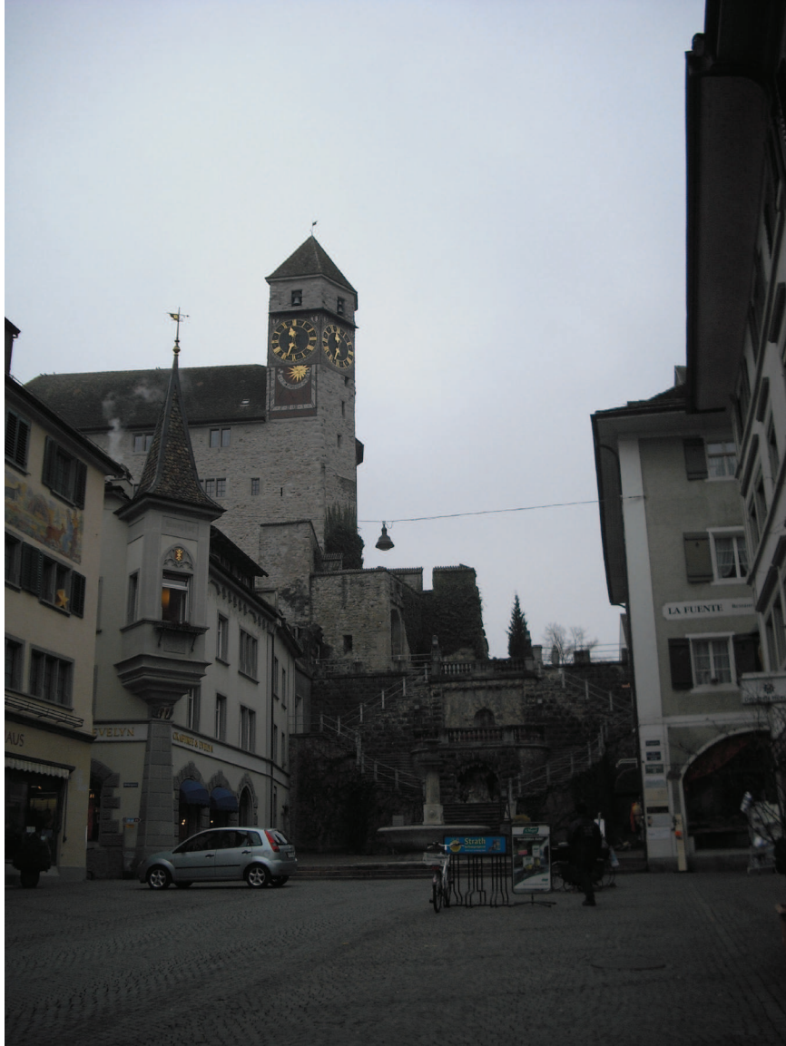
Zamek – Muzeum Polskie w Rapperswilu