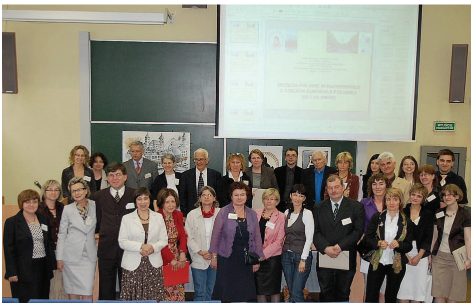
Uczestnicy konferencji w sali obrad