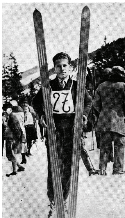
Fot. 7. Stanisław Marusarz najlepszy polski skoczek narciarski w okresie 20-lecia międzywojennego; źródło: „Tygodnik Ilustrowany” 1932, nr 12, s. 195.

Za najlepszego skoczka w okresie 20-lecia międzywojennego należy uznać Stanisława Marusarza (1913–1993). Przemawiają za tym jego sukcesy, m.in. mistrzostwo Polski w: 1932 r., 1933 r., 1935 r. 1936 r., 1937 r. i 1939 r. Czterokrotnie ustanawiał rekord Polski w skokach (w 1931 r. w Ponte di Legano – 74 m, w 1935 r. w Planicy – 87,5, 93 i 97 m), a także pięciokrotnie ustanowił rekord odległości skoczni na Krokwi, m.in. w: 1932 r. – 72 m, 1934 r. – 74 m, 1938 r. – 76,5 m. W omawianym czasie Stanisław Marusarz był wicemistrzem świata w skokach w 1938 r. i dwukrotnie uczestniczył w Igrzyskach Olimpijskich w Lake Placid 1932 r. oraz w Garmisch Partenkirchen w 1936 r. Za swoje sukcesy w 1938 r. został laureatem Wielkiej Honorowej Nagrody Sportowej, a także, w tym samym roku, zwyciężył w Plebiscycie Przeglądu Sportowego.