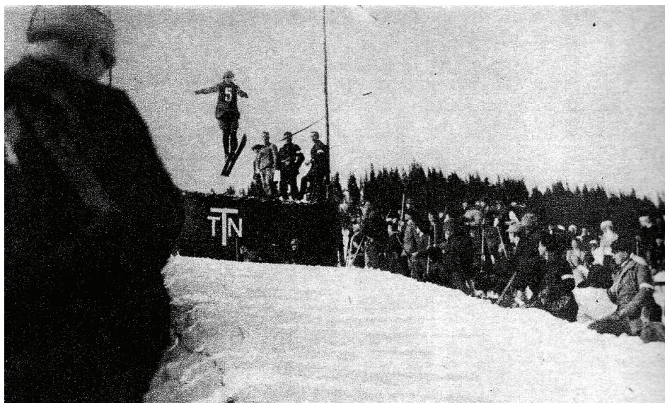
Fot. 5. 1911 r. skoki na skoczni narciarskiej TTN na Kalatówkach

Po powołaniu w 1919 r. Polskiego Związku Narciarskiego (PZN) pierwsze dwa lata zarząd poświęcił na działania związane z budową wewnętrznych struktur związku oraz na upowszechnianie narciarstwa wśród społeczeństwa polskiego. Osiągnięciem PZN było opracowanie i nowelizacja statutu, zorganizowanie Związkowych Narciarskich Mistrzostw Polski oraz udostępnienie skoczni narciarskich w Zakopanem na Jaworzynce, w Sławsku, Krakowie i Bielsku. W pierwszych pięciu latach istnienia PZN swoją działalność prowadził w oparciu o składki członkowskie, dochody z imprez narciarskich oraz z subwencji państwowych. Wraz z rozwojem biegów narciarskich niezależnie rozwijały się skoki narciarskie. Wcześniej, bo już w 1920 r., z inicjatywy działaczy SNPTT w Zakopanem oddano do użytku większą skocznię narciarską w Dolinie Jaworzynki pod Zakopanem, a w następnych latach skocznie powstawały w Krakowie, Lwowie, Sławsku i w Worochcie.