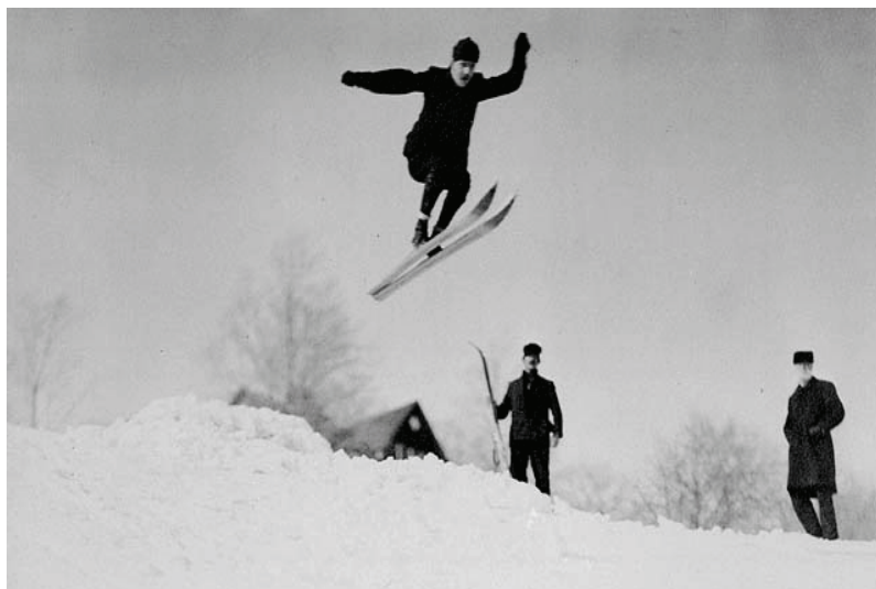
Fot. 4. Początki skoków na ziemiach polskich, na terenowej skoczni ze śniegu

Źródło: Z. Pręgowski, Dzieje narciarstwa polskiego do 1914 r. , Warszawa 1994, A. Fredro-Boniecki, Historia narciarstwa polskiego 1907–1914, Zestawienie ważniejszych zawodów z okresu do 1914 r. , „Narciarstwo Polskie” 1925, t. 1, s. 58–62.