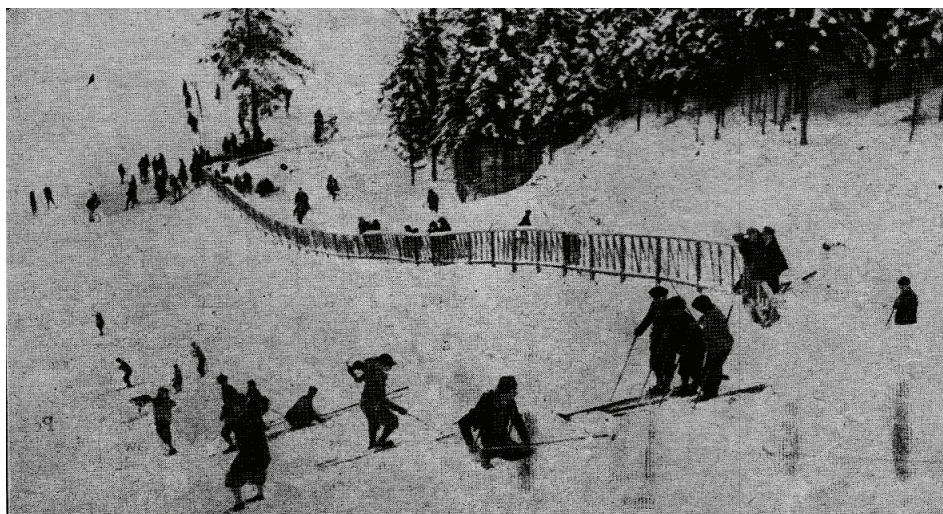
Fot. 3. Lipki k. Zakopanego, na niewielkiej skoczni śniegowej leży jeden z uczestników amatorskich skoków na nartach; źródło: „Stadjon” 1927, nr 3, s. 10.