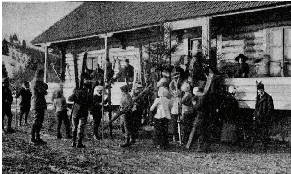
Fot. 2. 1913 r. uczestnicy kursu narciarskiego w Sławsku przed wyjściem na zajęcia